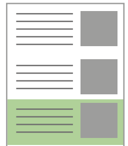
Bild: max. 50 KB, mind. 72 dpi, Dateiformat JPG, PNG oder GIF Zeichen: Text max. 400 Zeichen (mit Leerzeichen)

Bewerben Sie Ihr Produkt oder Neuheiten in einem ausgewählten Newsletter.